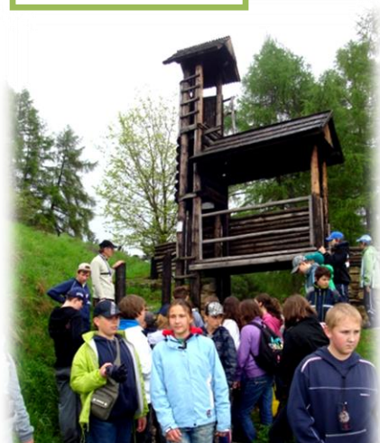
Keltské hradisko Havránok