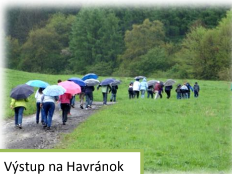
Výstup na Havránok