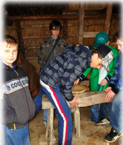
Práca na hrnčiarskom kruhu