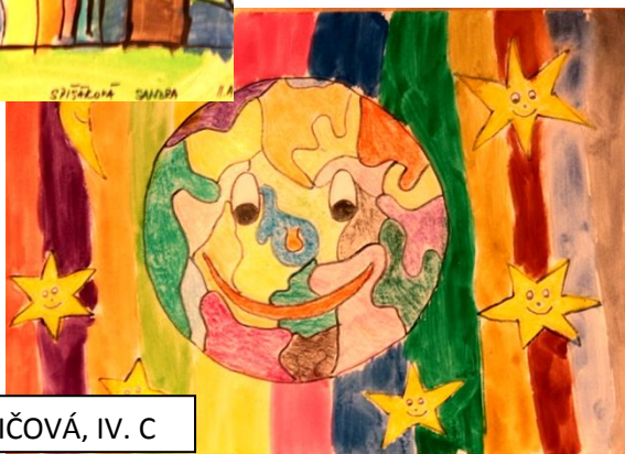
Evka ADAMOVIČOVÁ, IV. C