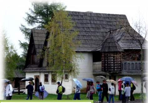
Skanzen v Pribyline