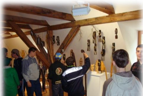
V múzeu ovčiarstva v Lipt. Hrádku